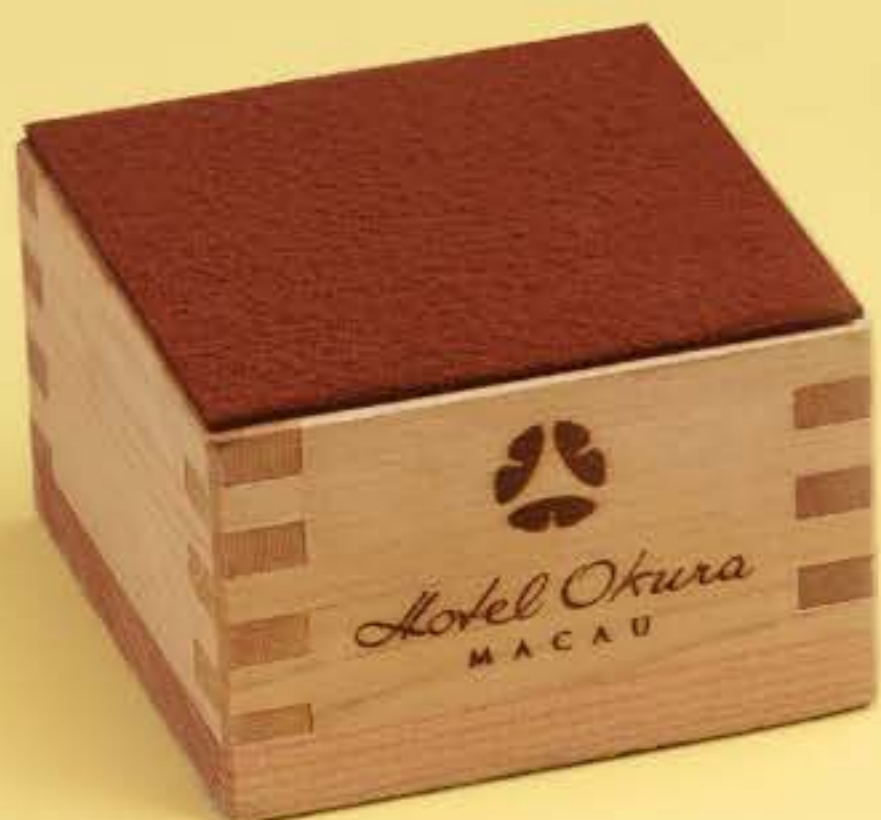
炭烧咖啡提拉米苏 Charcoal coffee tiramisu