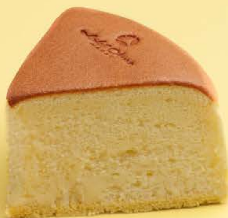
日式轻芝士蛋糕 Japanese soufflé cheesecake