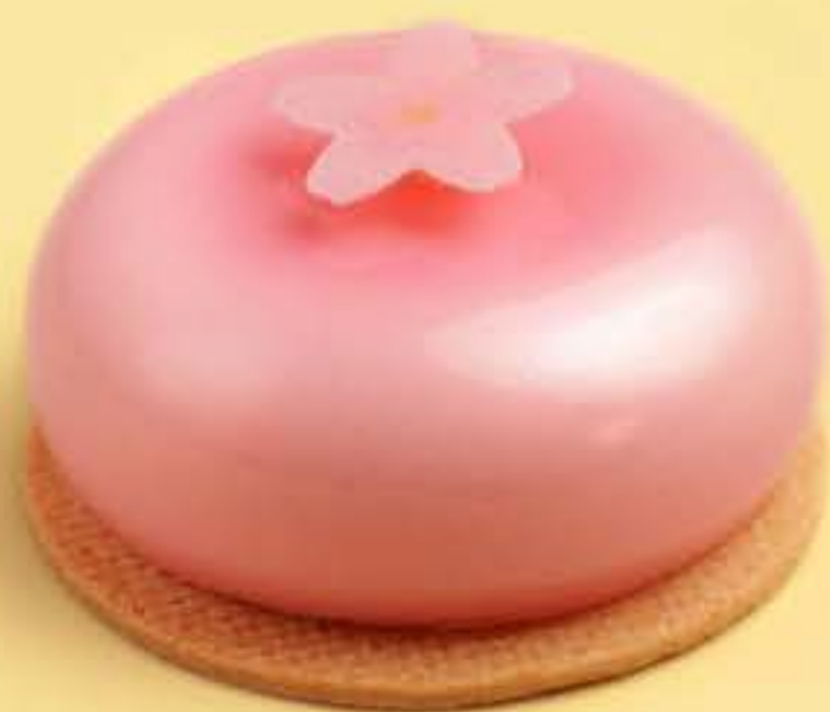
樱花樱桃蛋糕 Sakura cherry cake