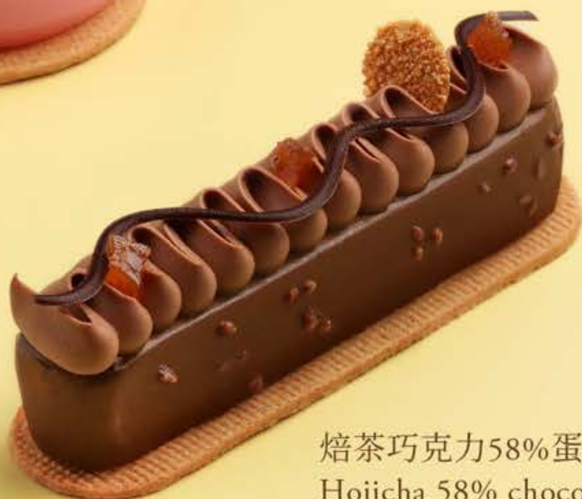
焙茶巧克力58%蛋糕 Hojicha 58% chocolate cake

所有价目以澳门元计算并需加收10%服务费及5%旅游税。 All prices are in MOP and subject to a 10% service charge and a 5% tourism tax.