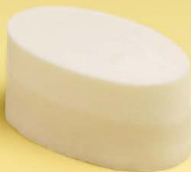
豆腐酸奶蛋糕 Tofu yogurt cake