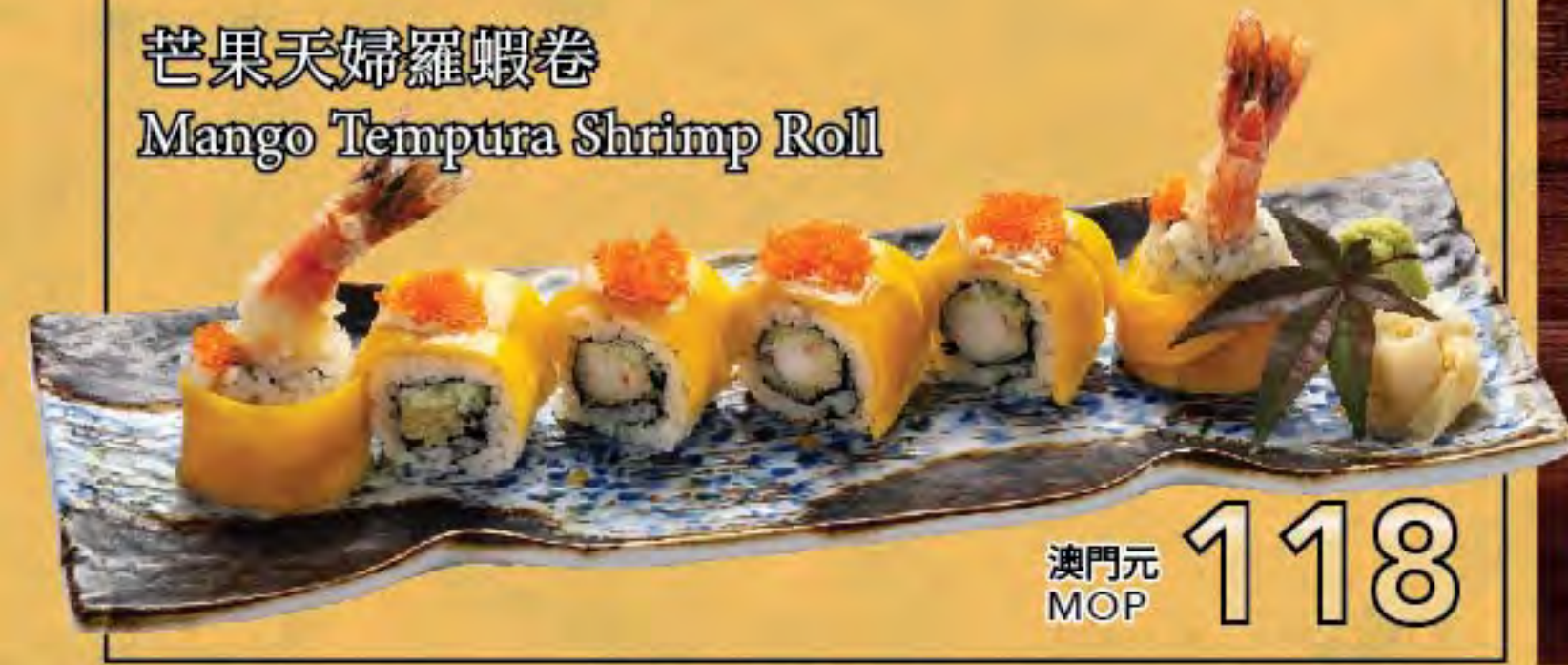
芒果天婦羅蝦卷 Mango Tempura Shrimp Roll