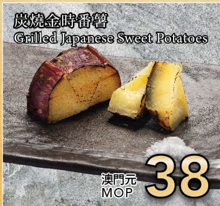
炭燒金時番薯 Grilled Japanese Sweet Potatoes