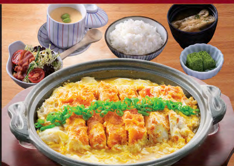
北海道名產！ 十勝豚肉丼定食 Tokachi-style Pork Rice Bowl Set