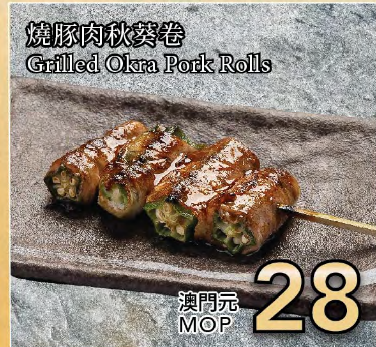
燒豚肉秋葵卷 Grilled Okra Pork Rolls