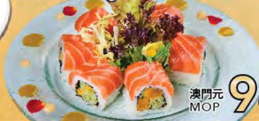
香芒三文魚卷 Salmon Mango Roll