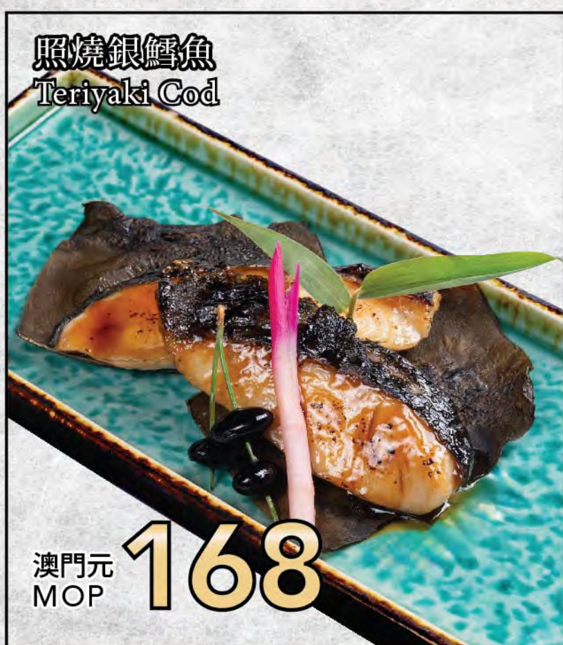
照燒銀鱈魚 Teriyaki Cod