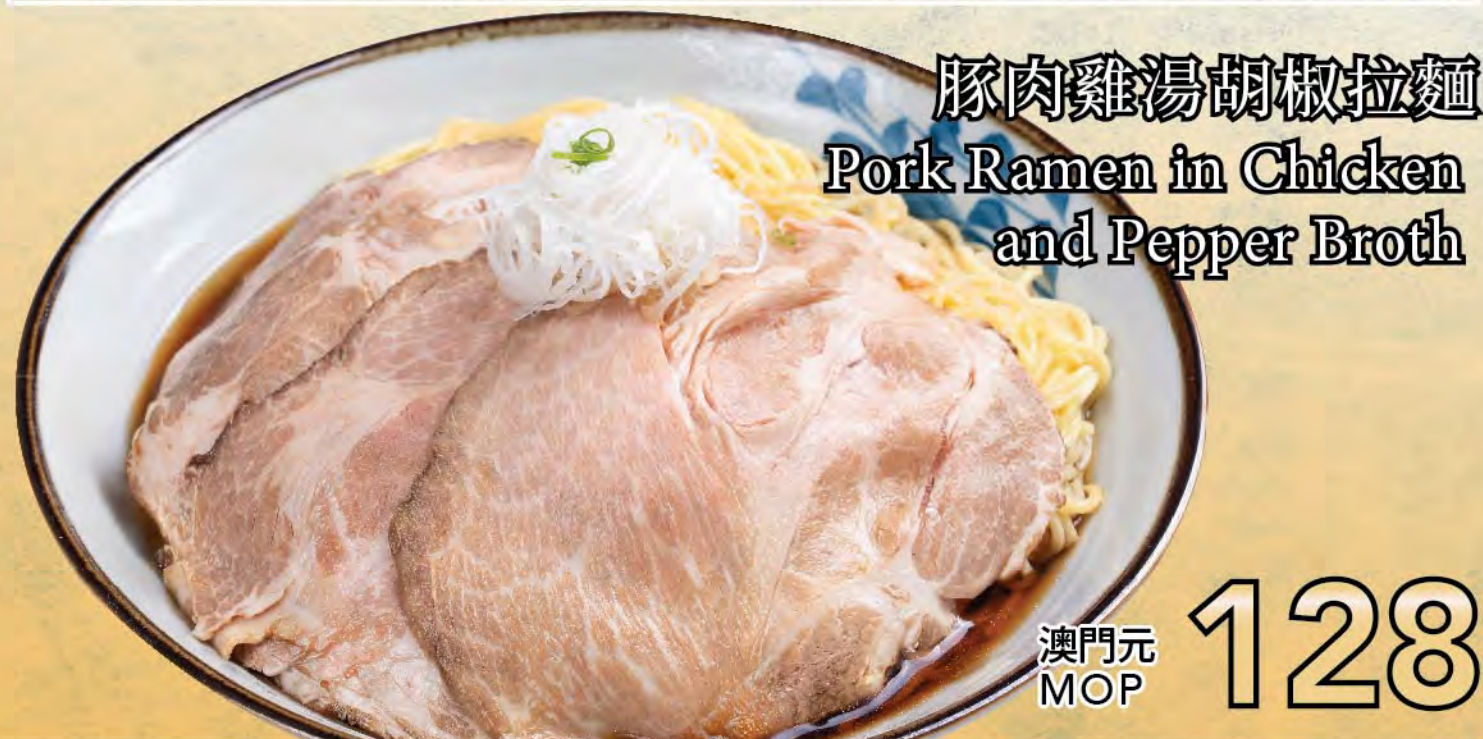
豚肉雞湯胡椒拉麵 Pork Ramen in Chicken and Pepper Broth 澳門元 MOP 128