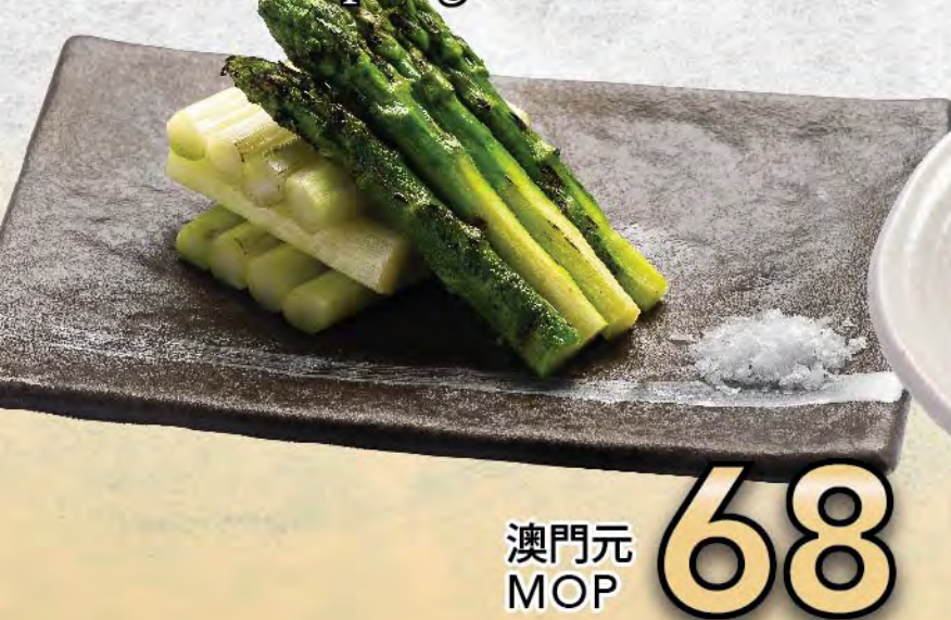
牛油燒蘆筍 Grilled Asparagus with Butter