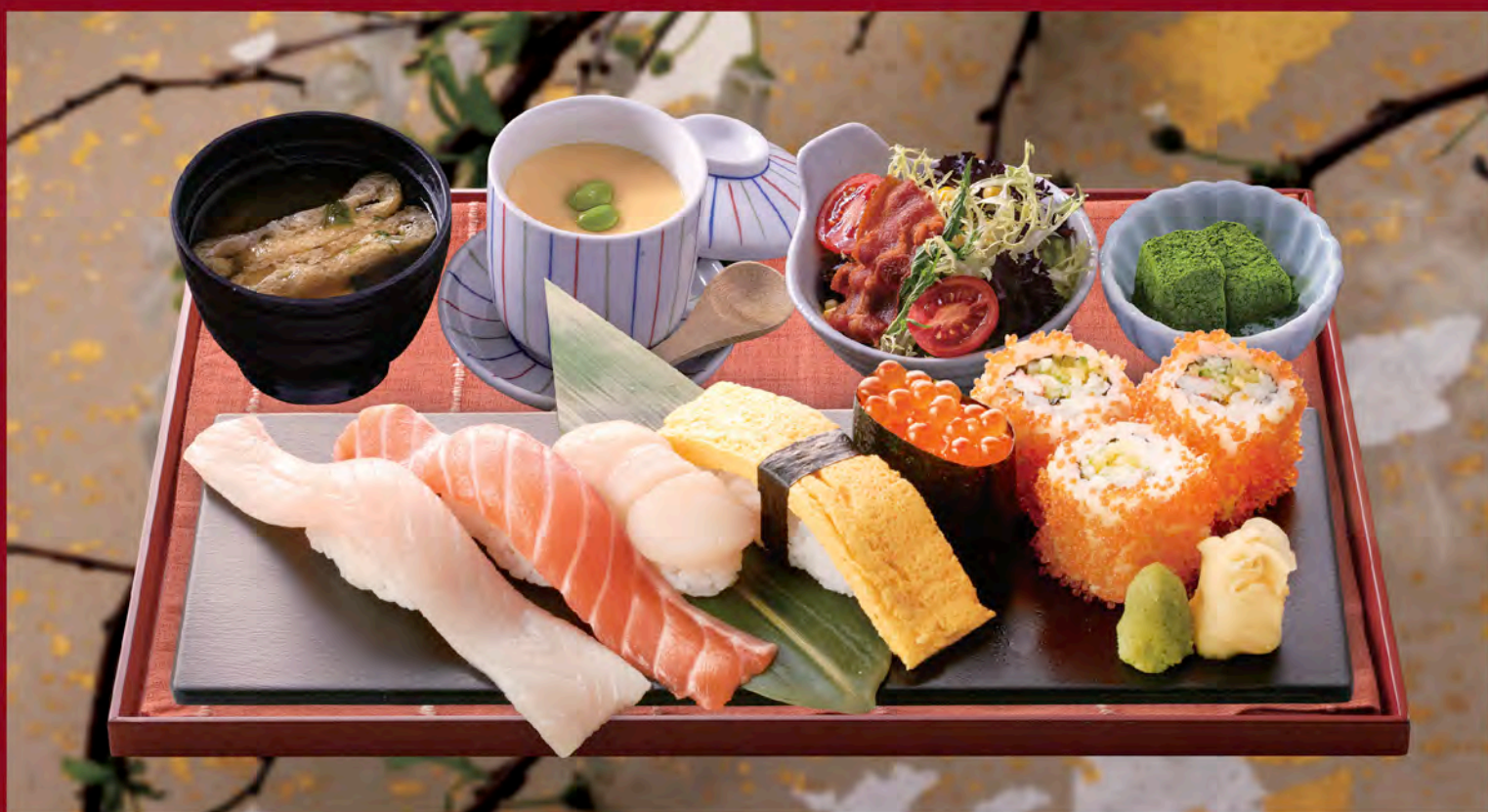
壽司盛合 & 迷你烏冬豪華定食 Assorted Sushi & Mini Udon Set