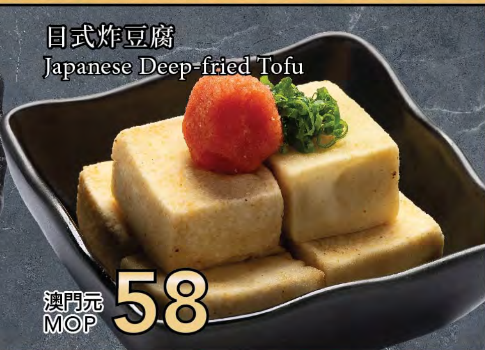
日式炸豆腐 Japanese Deep-fried Tofu