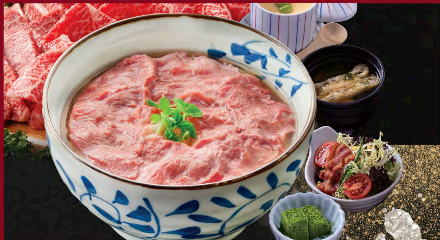
極上九州和牛讚岐烏冬豪華定食 Kyushu Wagyu Sanuki Udon Set