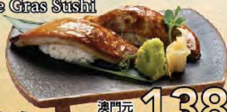
鵝肝壽司 Foie Gras Sushi