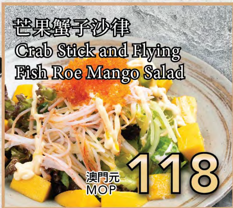
芒果蟹子沙律 Crab Stick and Flying Fish Roe Mango Salad