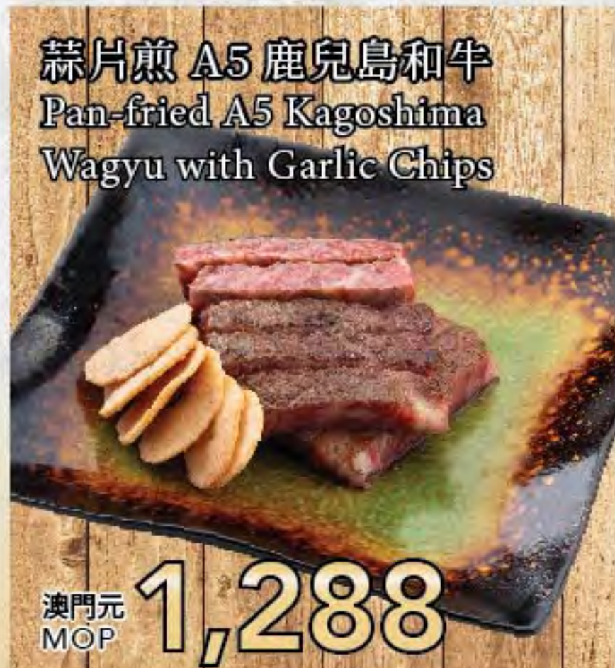
蒜片煎 A5 鹿兒島和牛 Pan-fried A5 Kagoshima Wagyu with Garlic Chips