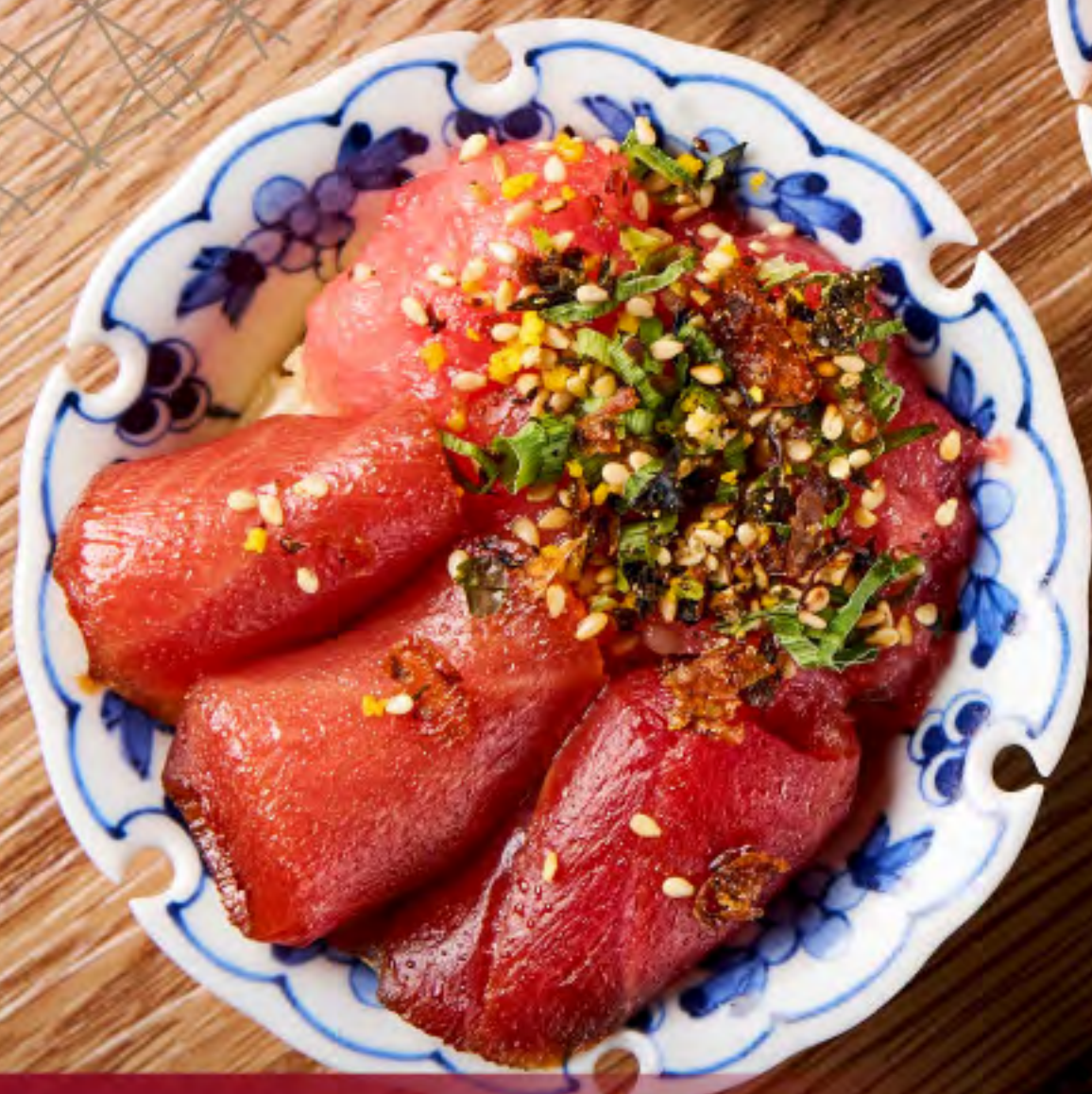
赤身與吞拿魚碎丼 Tuna Akami and Chopped Tuna Sashimi Don