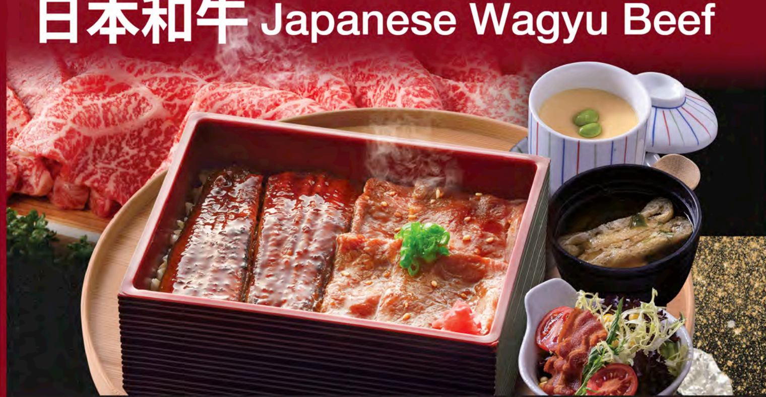
極上九州產和牛鰻魚盒子飯豪華定食 Eel & Japanese Wagyu Rice Bento Set