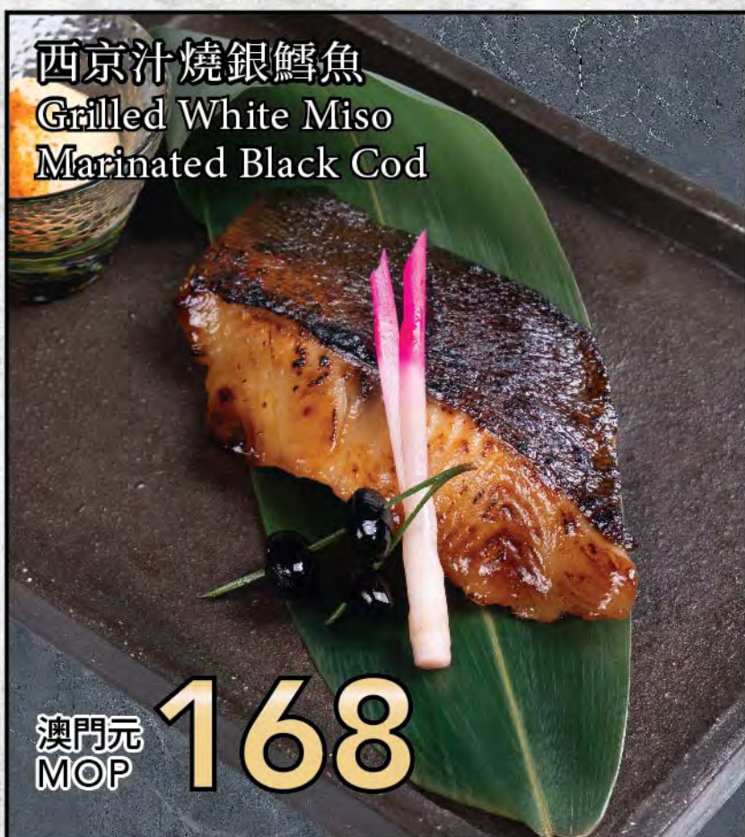
西京汁燒銀鱈魚 Grilled White Miso Marinated Black Cod