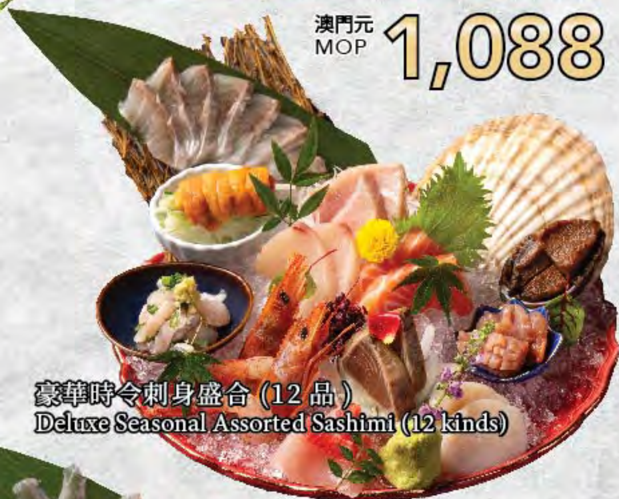
豪華時令刺身盛合 (12 品) Deluxe Seasonal Assorted Sashimi (12 kinds)