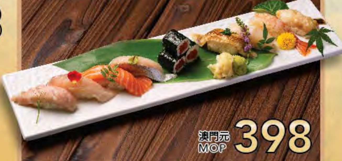
時令壽司盛合 Seasonal Assorted Sushi