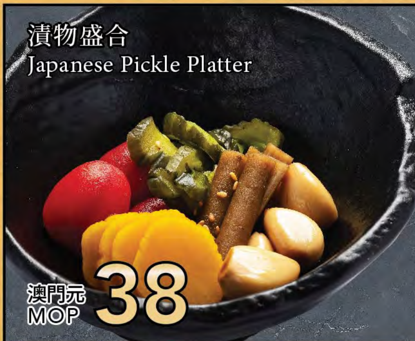
漬物盛合 Japanese Pickle Platter