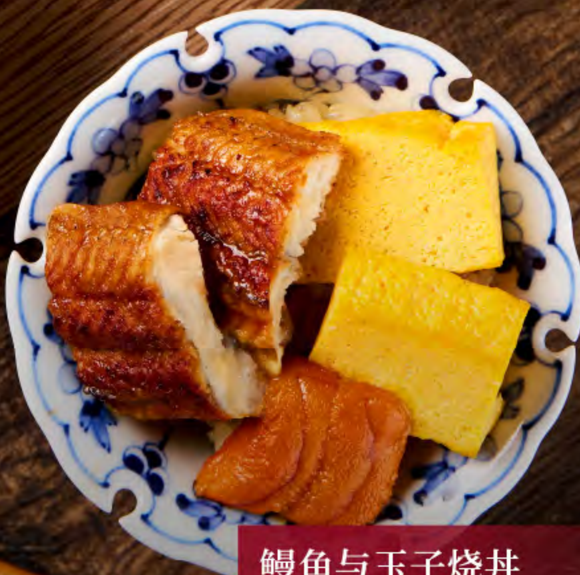
鰻魚與玉子燒丼 Grilled Eel & Japanese Rolled Omelet Don