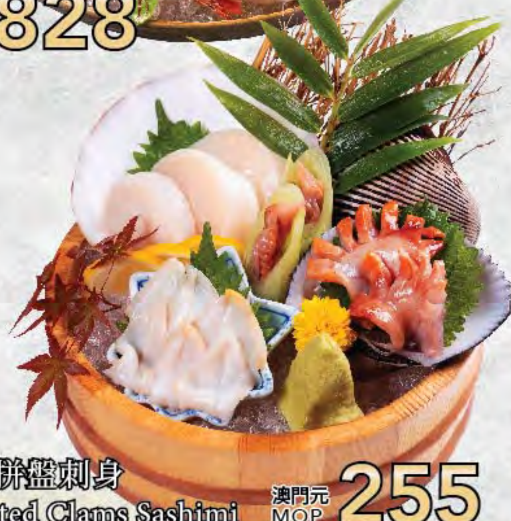
貝類拼盤刺身 Assorted Clams Sashimi