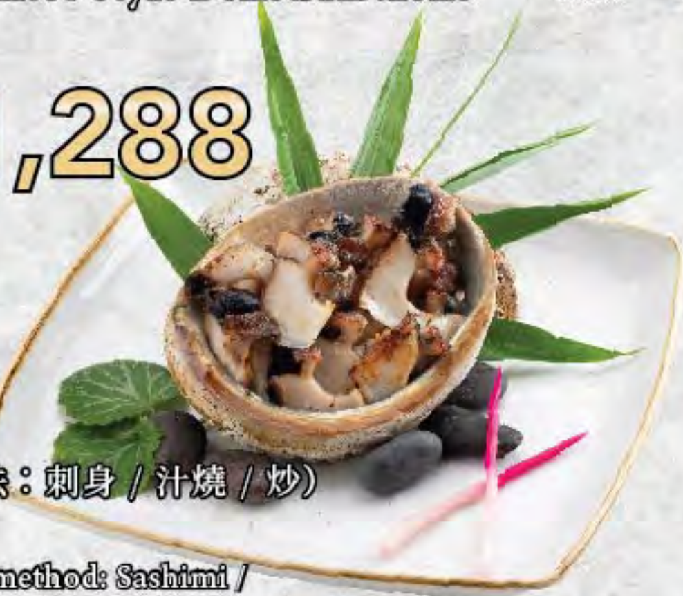
鮑魚 (烹調方法：刺身 / 汁燒 / 炒) Abalone (Cooking method: Sashimi / Pan-fried with Sauce / Sautéed)