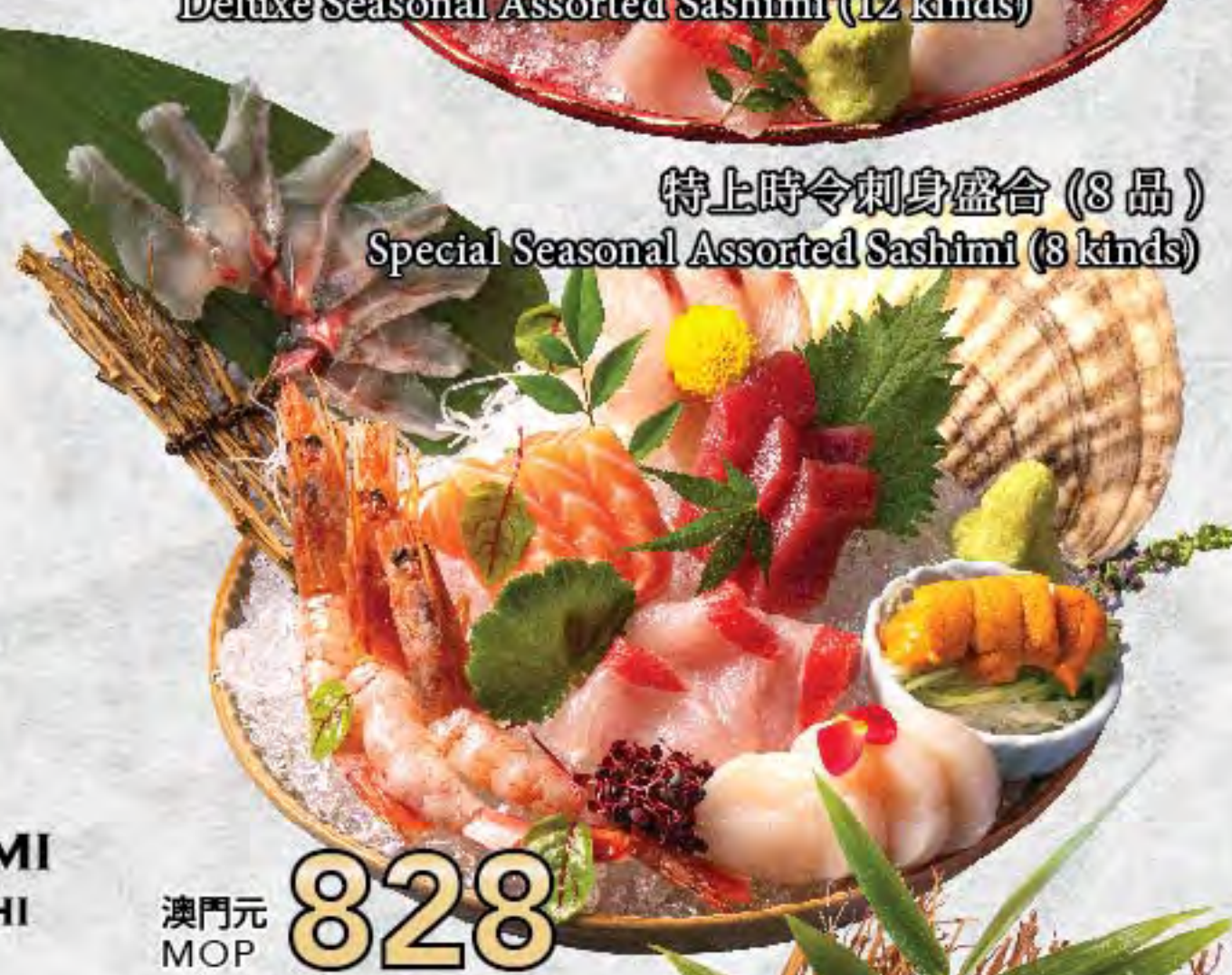
特上時令刺身盛合 (8 品) Special Seasonal Assorted Sashimi (8 kinds)