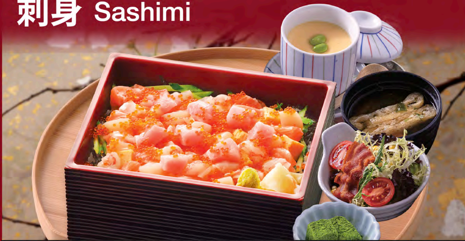
角切魚生盒子飯豪華定食 Assorted Diced Sashimi Rice Bento Set