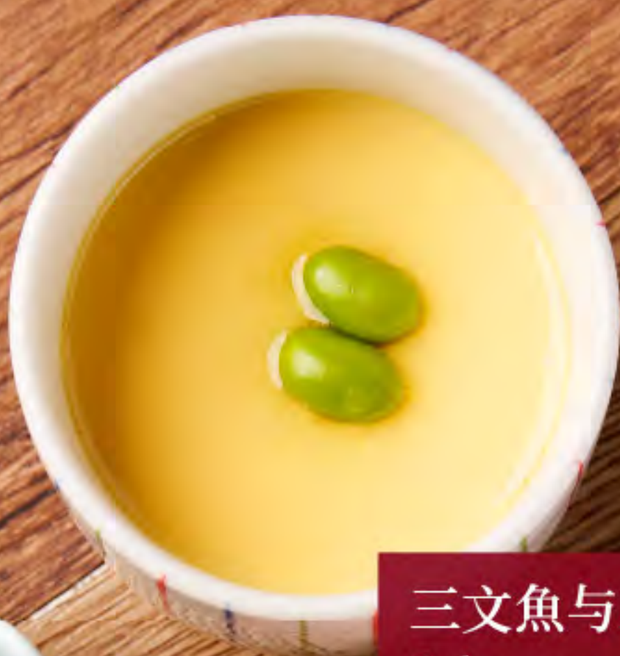
三文魚與三文魚子丼 Salmon and Salmon Roe Sashimi Don