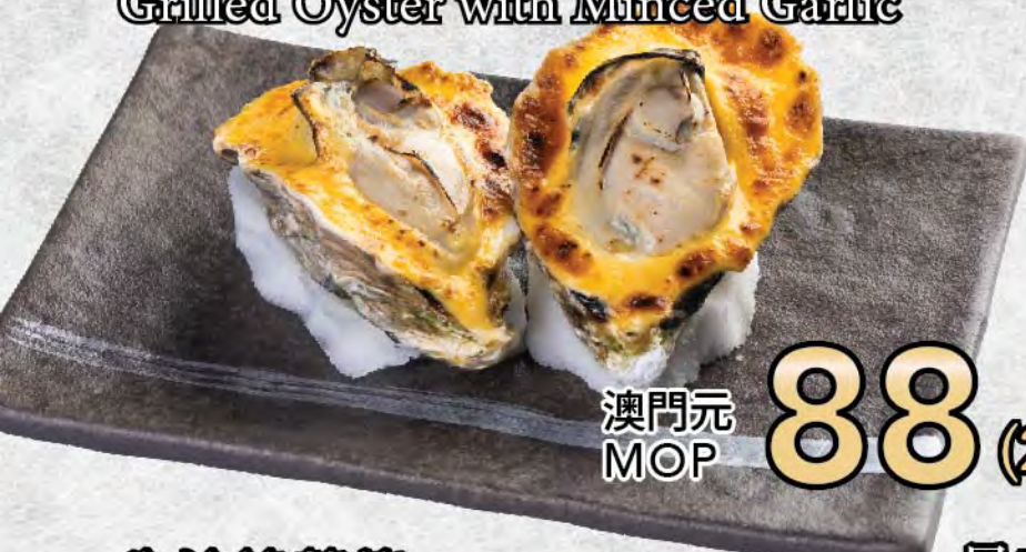
黃金燒蠔 Grilled Oyster with Minced Garlic

日式茄子燒 Japanese Grilled Eggplant 澳門元 MOP 58