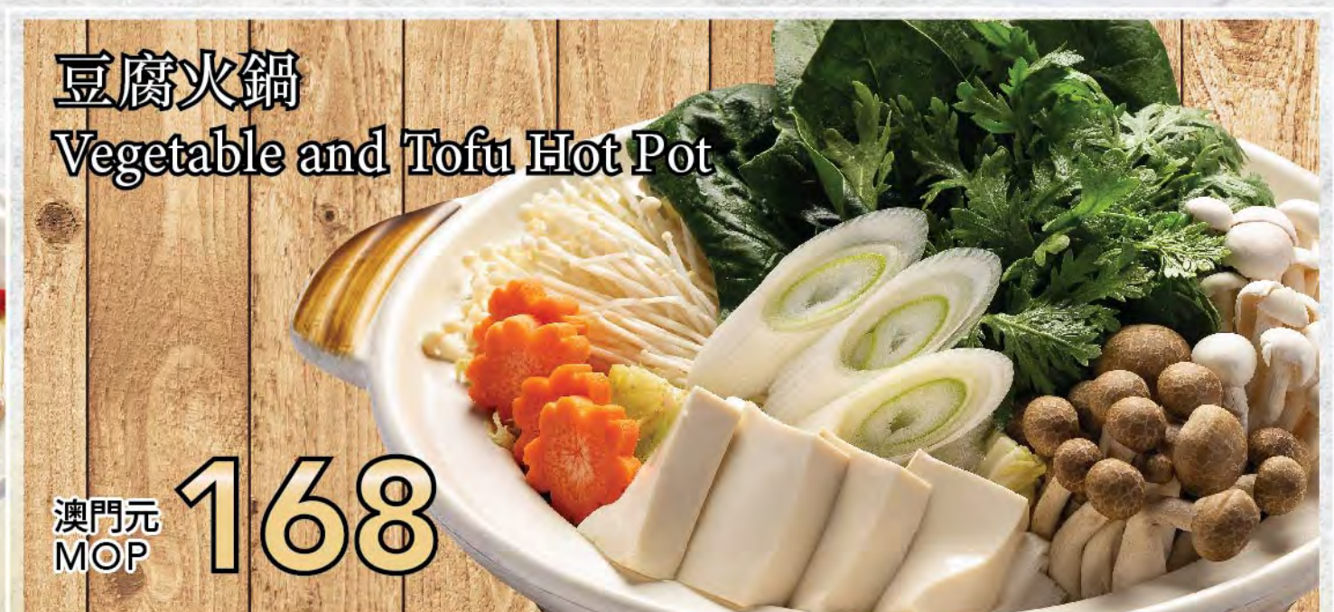
豆腐火鍋 Vegetable and Tofu Hot Pot