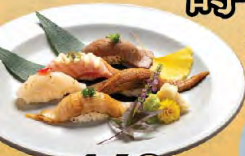
火炙壽司盛合 Broiled Sushi