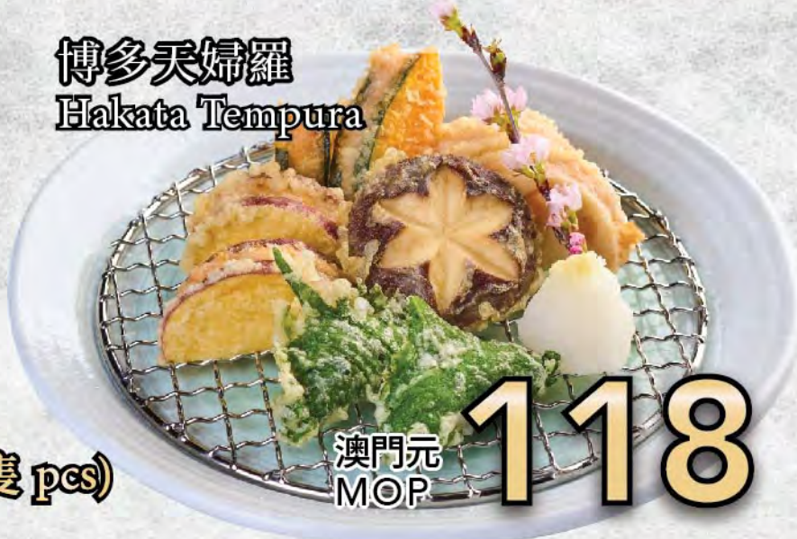
博多天婦羅 Hakata Tempura