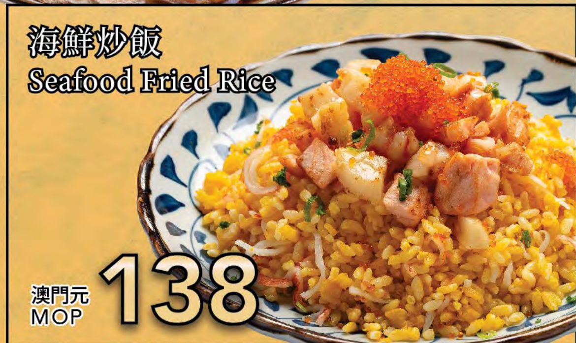
海鮮炒飯 Seafood Fried Rice