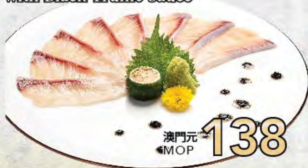
黑松露醬拼油甘魚刺身 Yellowtail Sashimi with Black Truffle Sauce