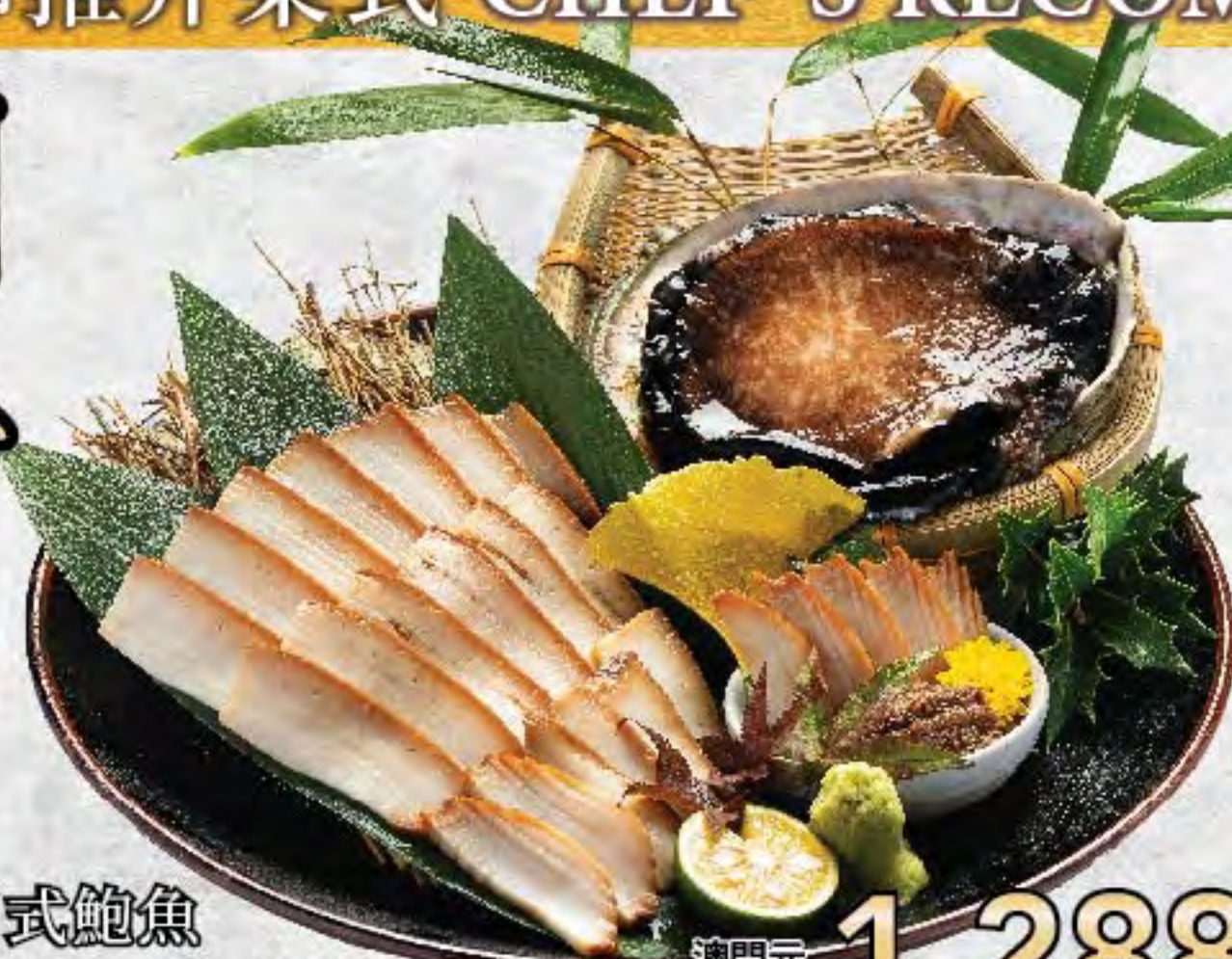
磯煮日式鮑魚 Japanese Style Boiled Abalone