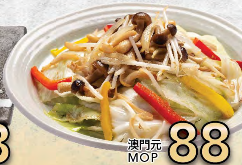
日式炒野菜 Japanese Stir-fried Vegetables