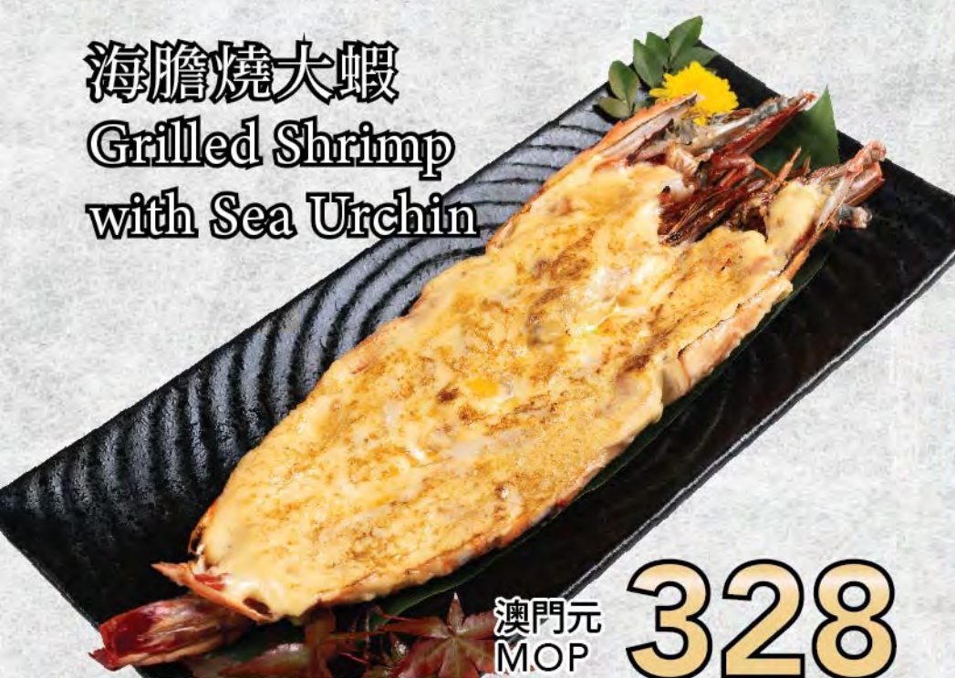
海膽燒大蝦 Grilled Shrimp with Sea Urchin

金菇牛肉卷 Enoki Mushroom and Beef 澳門元 MOP 168