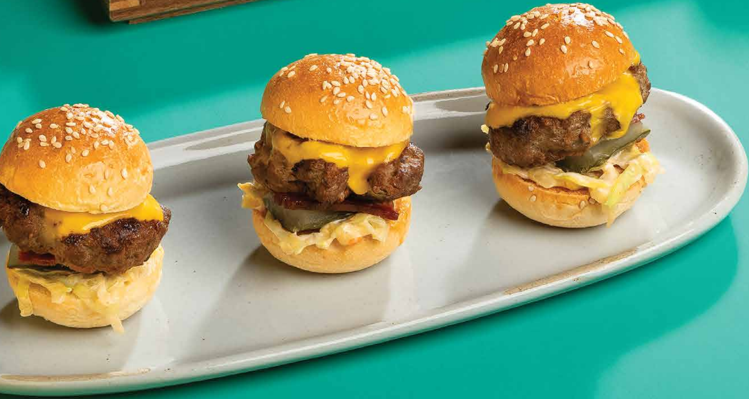
安达仕迷你汉堡 (3个) Andaz Mini Burger (3 Pcs)